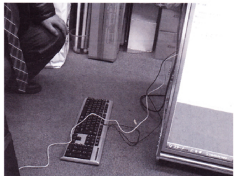
キーボードを接続しての直接操作も行なえる

能だ。動画を大胆に組み合わせれば、顧客を驚かすような迫力あるコンテンツが出来るかも知れない。もし、自社で制作ができなければ外注も引き受ける。制作費は1機種あたり50000円で、入替が5機種なら2万5000円でコンテンツが入手できる。あと1つの特徴は、スケジュール管理機能を搭載していること。予め放映する時間や曜日を設定しておけば、自動的に指定した