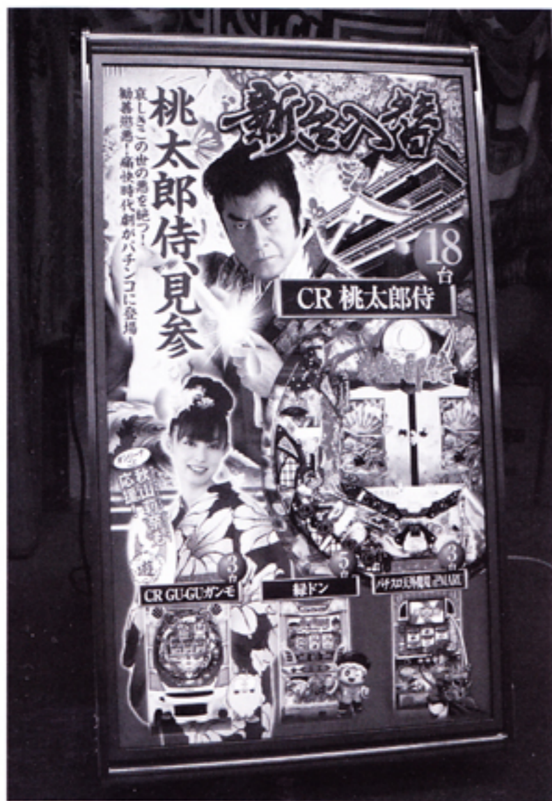
「CoroZo-40」に映し出された新台情報

その鮮明で光り輝く画面を見る と、誰もが立ち止まって眺めるほど の強い印象を与える。これまで大型 サイズの「ShowZo-K46」は、 市役所や病院などに設置されてき