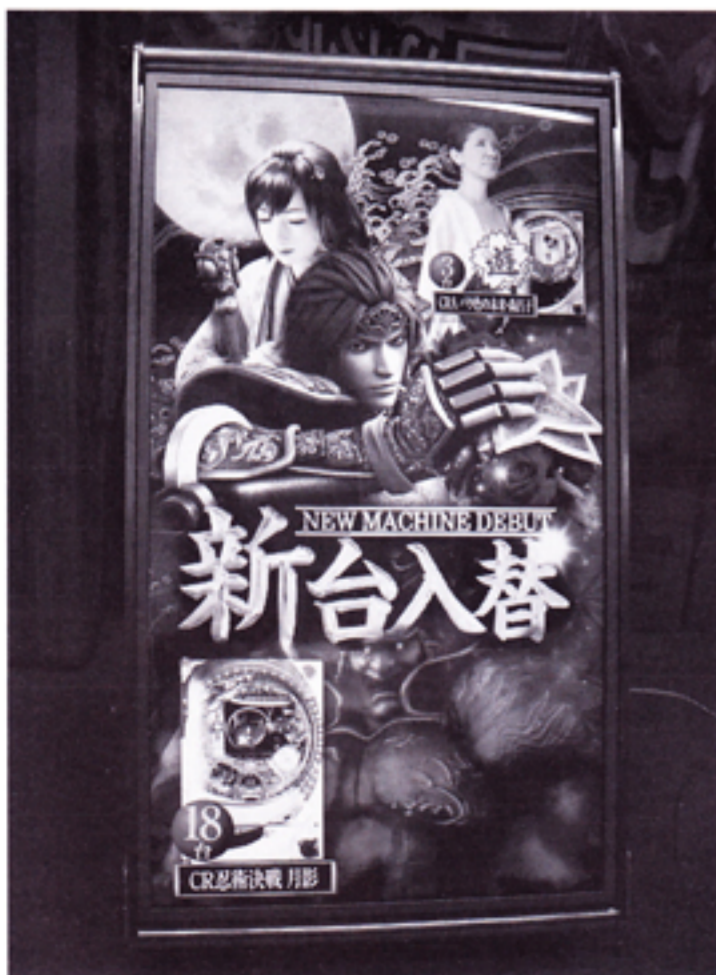
動画を組み入れた鮮やかなコンテンツ