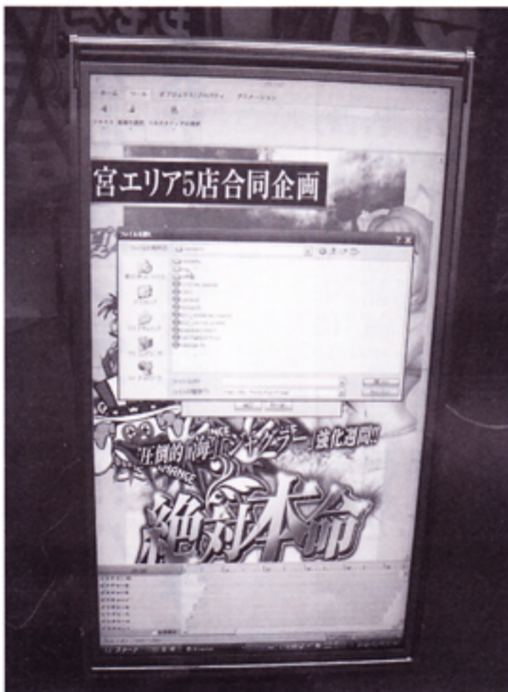
パソコンに取り入れられた素材の数々