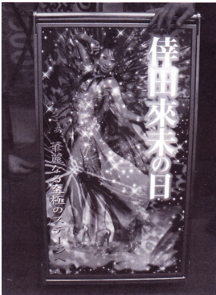
目を惹きつける映像の鮮やかな演出