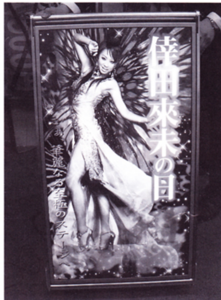
40インチ画面に映った迫力映像